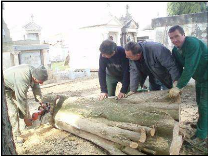
Abattage d'un cyprès menaçant de tomber au cimetière.

Ce début d'année restera marqué par la violente tempête qui a touché notre commune. Là encore, il est remarquable de voir la solidarité jouer son rôle, entre voisins, bénévoles, employés municipaux, élus et entreprises. Tous ont répondu présents pour réparer les blessures de notre village. Merci à tous.