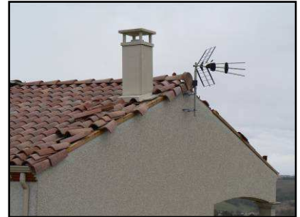
Toiture d'un habitation éventrée par les violentes bourrasques