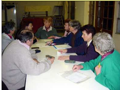
Le conseil d'administration.

C'est le 1er février que le club des Fils d'Argent a soufflé sa première bougie au cours de son assemblée générale en présence du Maire, Président d'Honneur. La