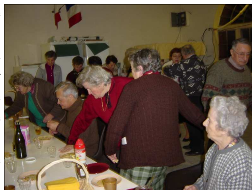
(A.G le moment des crêpes).

La soirée s'est terminée tard au tour d'un verre de cidre qui accompagnait de gros plats de crêpes.